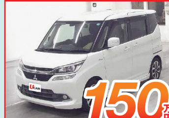
【三菱】D.2 カスタム HV SV Navi