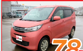
【三菱】eKワゴン M 4WD