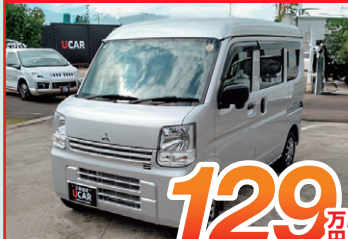
【三菱】ミニキャブバン 4WD